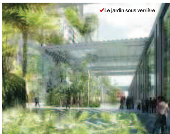
✓ Le jardin sous verrière